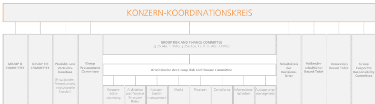
ABB. 1 – STEUERUNGSGREMIEN DER DZ BANK GRUPPE

Der Konzern-Koordinationskreis ist das oberste Steuerungs- sowie Koordinationsgremium der DZ BANK Gruppe. Ziele des Konzern-Koordinationskreises sind die Stärkung der Wettbewerbsfähigkeit der DZ BANK Gruppe und die Koordination in Grundsatzfragen der Produkt- und Vertriebskoordination. Außerdem beabsichtigt das Gremium, die Abstimmung zwischen den wesentlichen Unternehmen der DZ BANK Gruppe im Hinblick auf eine konsistente Chancen- und Risikosteuerung, die Kapitalallokation, strategische Themen sowie die Hebung von Synergien zu gewährleisten. Dem Konzern-Koordinationskreis gehören der Gesamtvorstand der DZ BANK sowie die Vorstandsvorsitzenden der BSH, DZ HYP, DZ PRIVATBANK, R+V, TeamBank, UMH und VR Smart Finanz an.